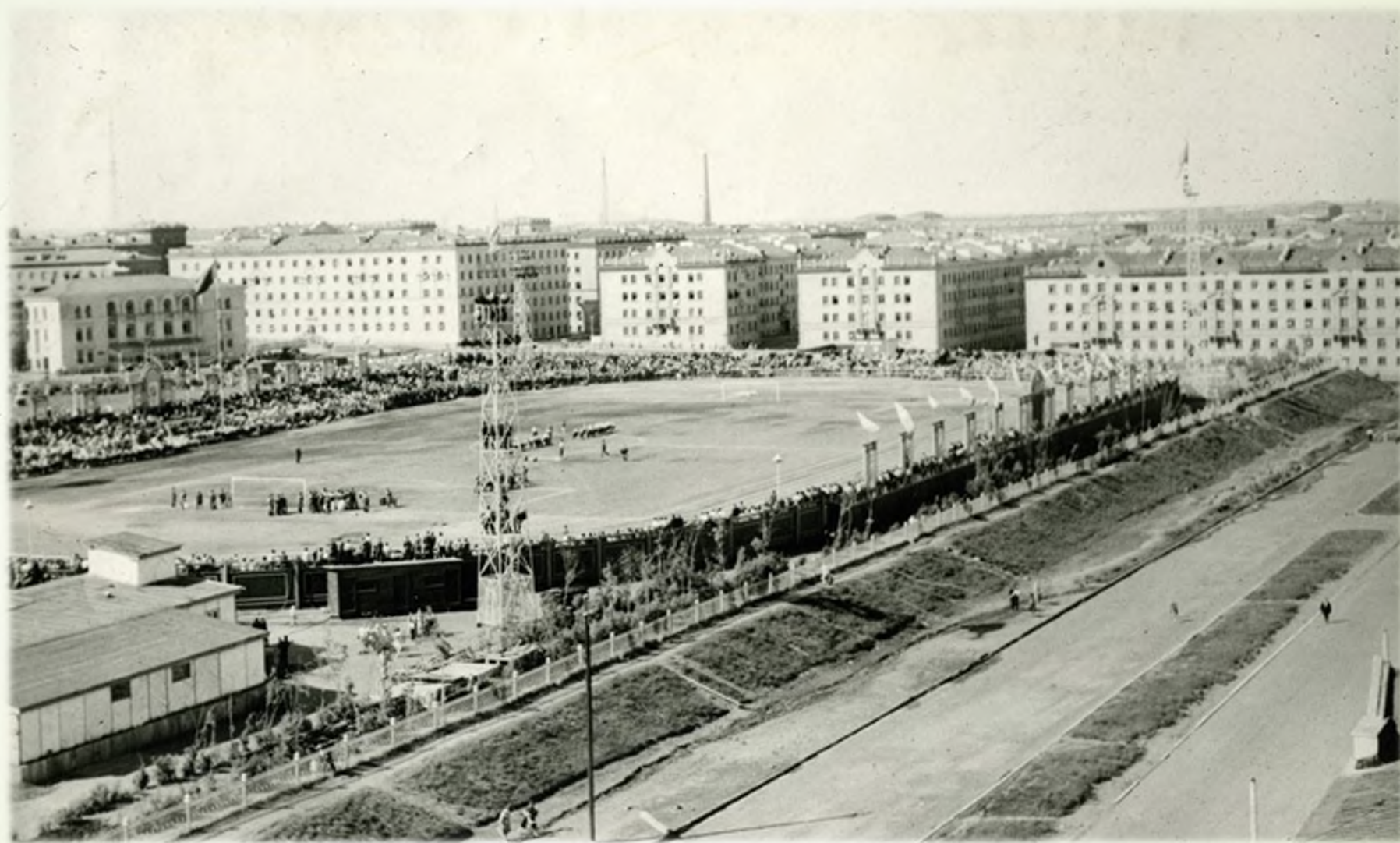
Спортивный праздник на стадионе «Заполярьник», 1960-е гг.