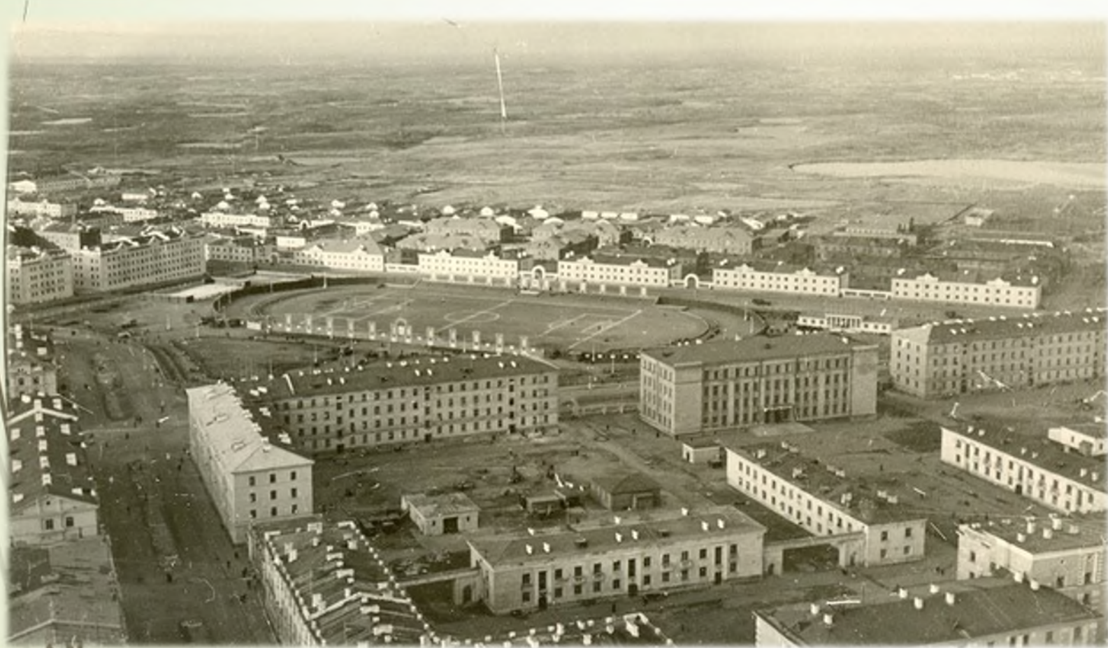
Стадион «Заполярьник». 1960-е гг.