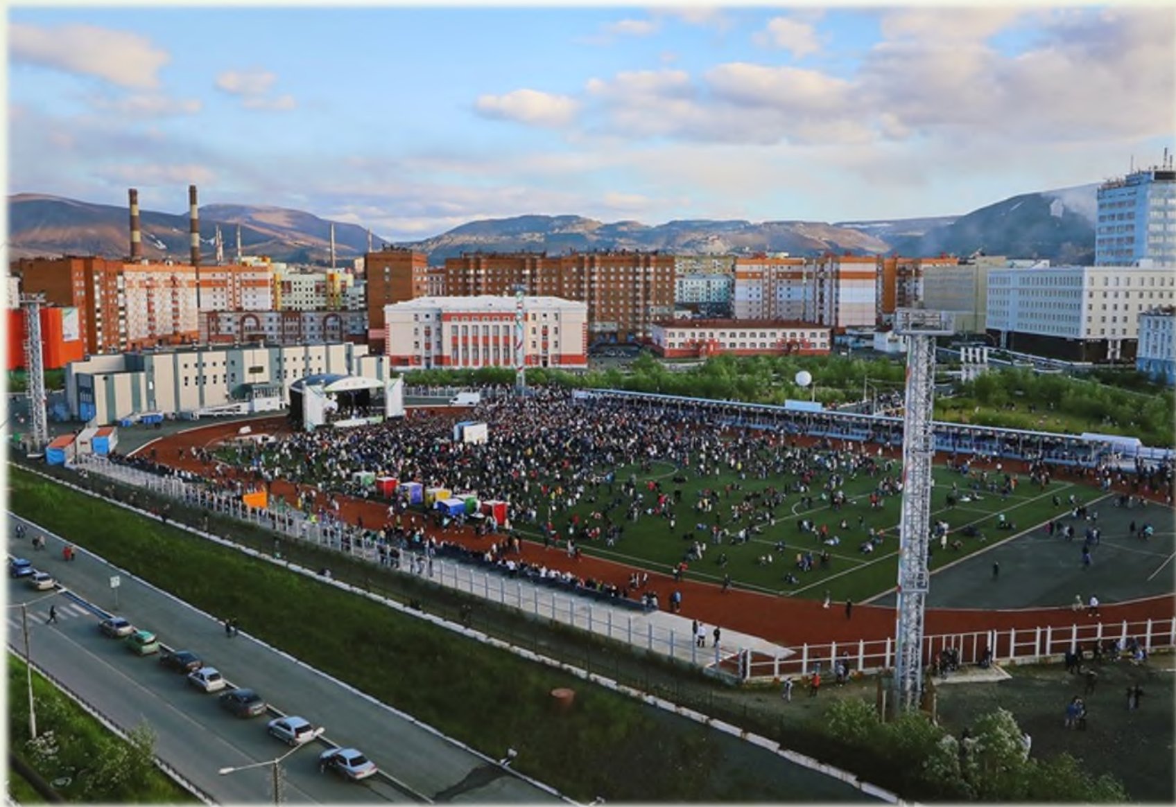
65-летний юбилей города Норильска. Концерт на стадионе «Заполярьник». 14.07.2018 г.