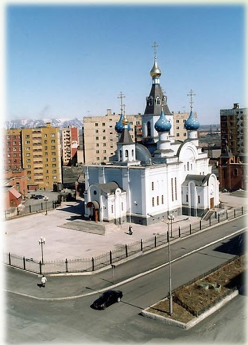
Кафедральный собор иконы Божьей Матери «Всех скорбящих Радость». Начало 2000-х гг.