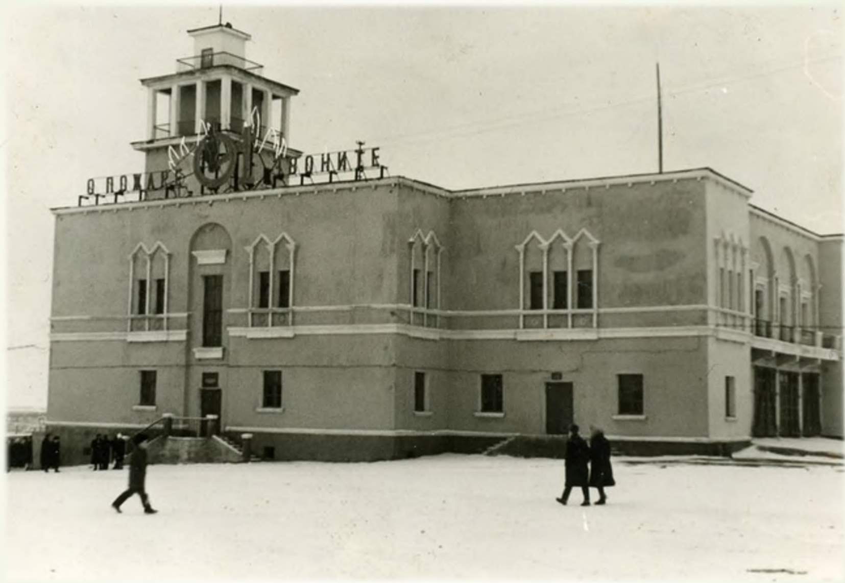
Пожарная часть на пересечении ул. Кирова и ул. Пушкина. 1970-е гг.