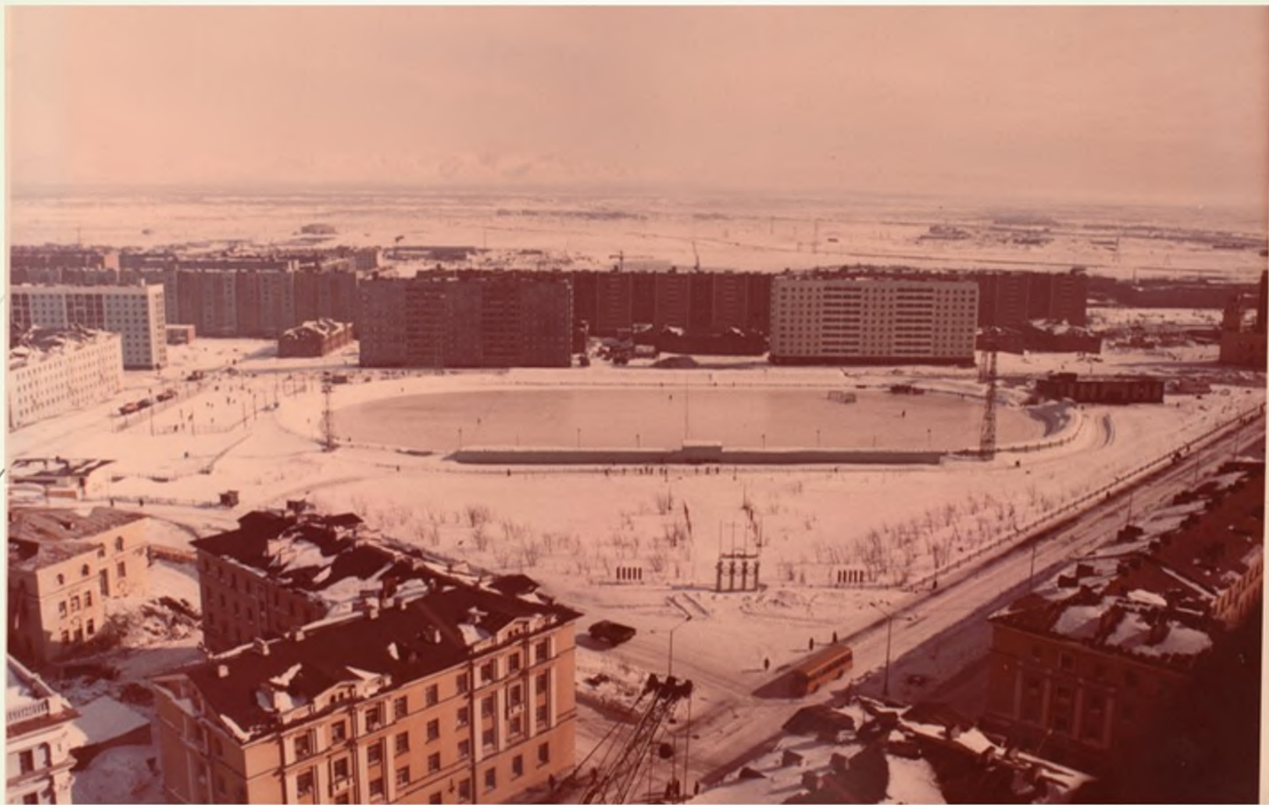
Стадион «Заполярьник», ул. Пушкина. 1989 г.