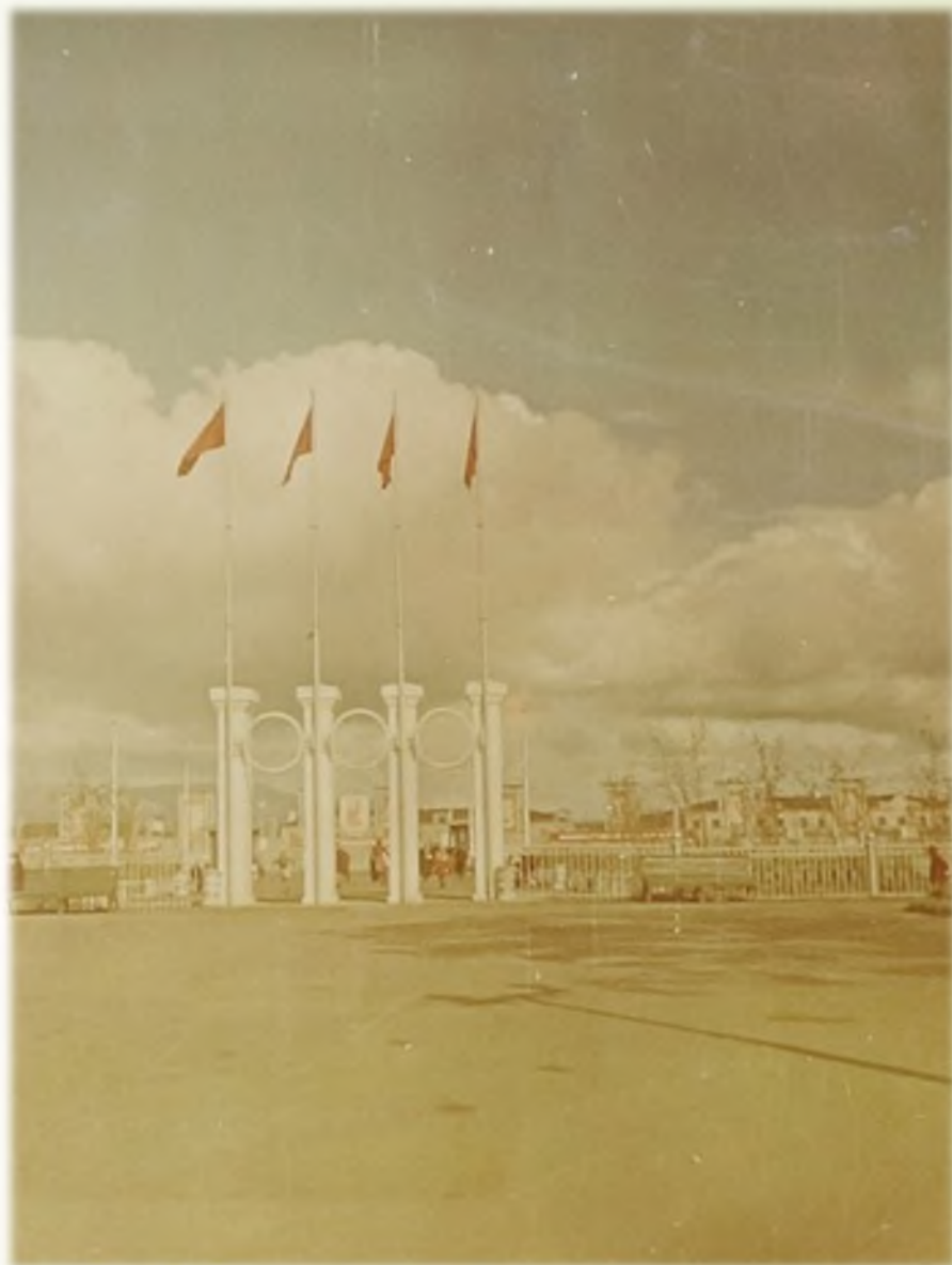
Входная группа стадиона «Заполярьник»