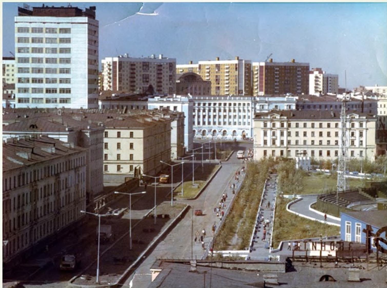
Улица Пушкина, вид с пожарной вышки на пл. Гвардейскую. 1980-е гг.