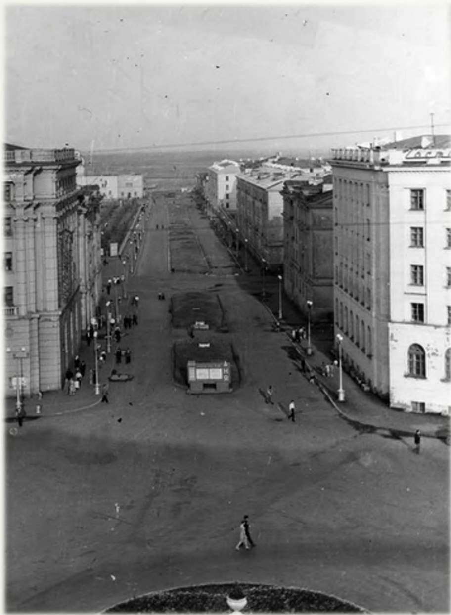
Улица Пушкинская. 1970 г.