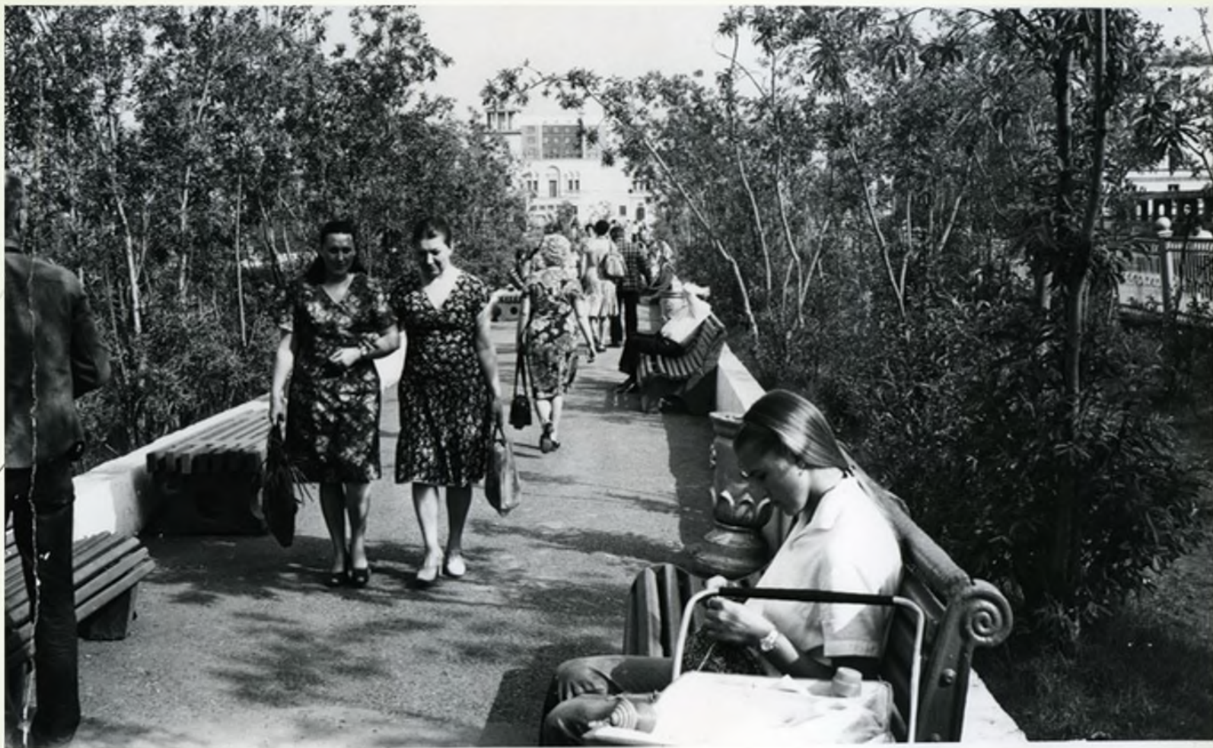
Сквер на ул. Пушкинской, 1980-е гг.