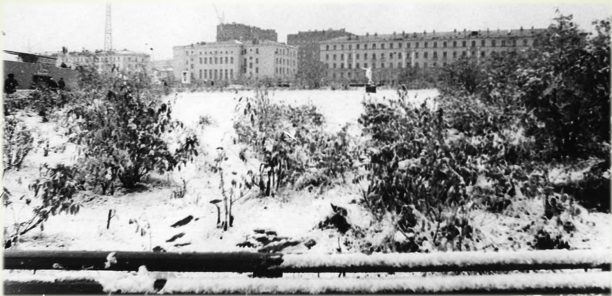
Сквер им. Пушкина. Школа № 4. 1980 г.