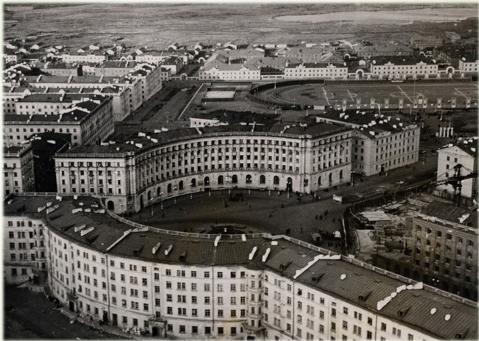
Виды Норильска. 1950-е гг.