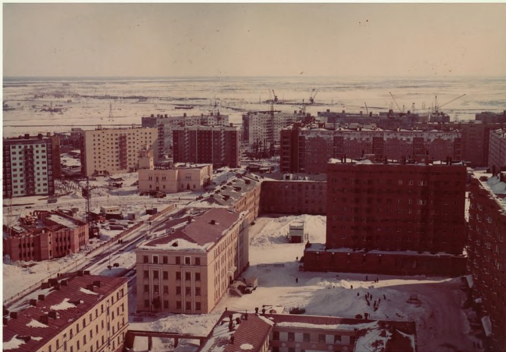
Улица Пушкина (вид со стороны Ленинского проспекта). 1989 г.